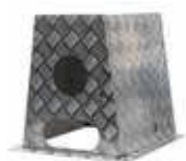
AB | AB COFANO IN ALLUMINIO MANDORLATO ALUMINUM BOX