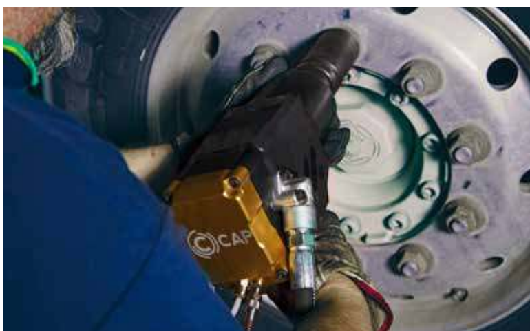
IMPACT WRENCH K350