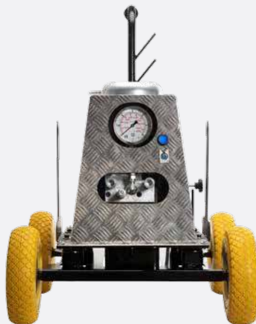
CUSTOMIZED STP POWER UNIT

Along with the line of hydraulic power units, we offer a complete range of accessories such as rice-grain aluminum cover, heat exchanger, oversized wheels, hydraulic extensions and fittings.