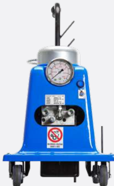
POWER UNIT STP-SERIES

User-friendly and powerful control units. Accurate pressure regulation ensures tightening torque repeatability.