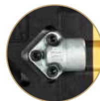
T = Raccordi 90° 90° Fittings