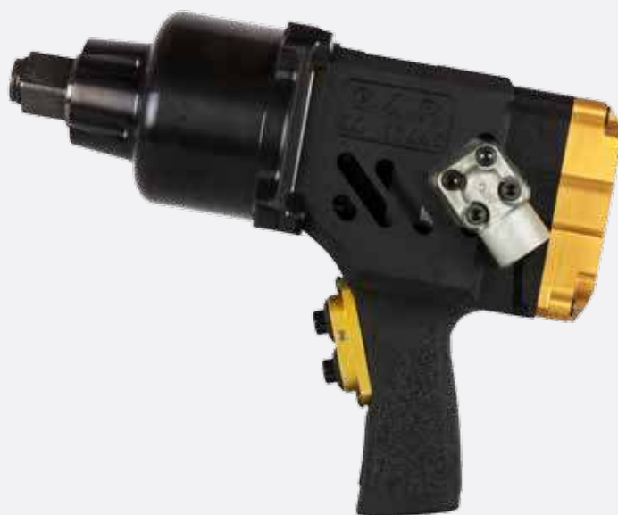
IMPACT WRENCH K560

Powerful and fast. Accurate and efficient. To offer you a reliable, durable and flexible bolting system for maintenance and industrial production.