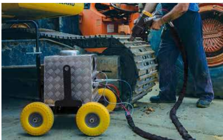
CUSTOMIZED STP POWER UNIT