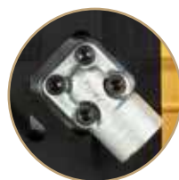
W = Raccordi 45° 45° Fittings