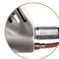
B = Posteriore Back